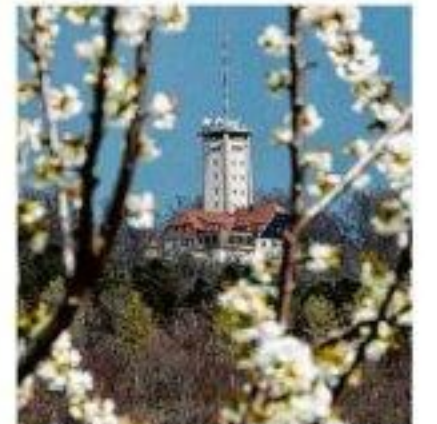
Der Roßbergturm ist Ziel der Familienwanderung im April.